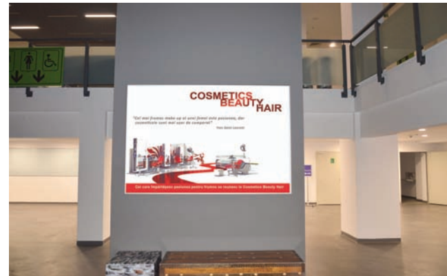
CASETA CU RAMA CLICK, DIMENSIUNE 200X140 CM